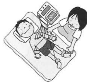
[96] 心電図検査の様子