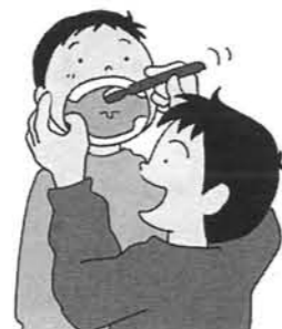
[101] 正面から介助みがき3