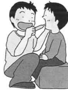
[99] 正面から介助みがき