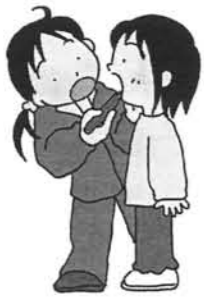
[100] 正面から介助みがき2