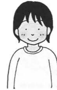
[109] 体温計測おしまい