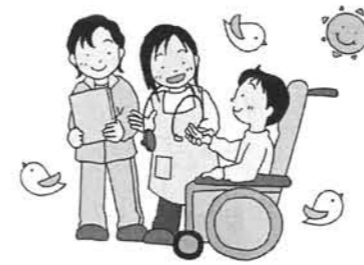
[112] 朝のバイタルチェック