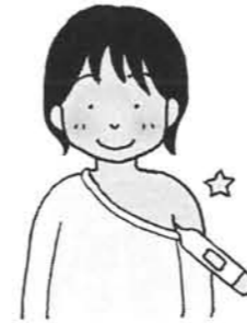
[106] 体温計はさみます