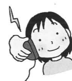
[113] 聴力検査(レシーバー)